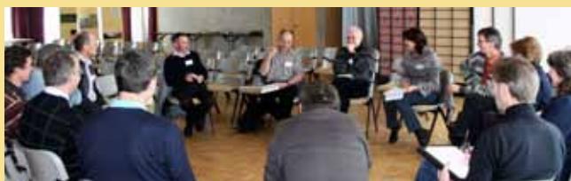
Un groupe en pleine réflexion aux états généraux du Parc, le 20 février 2010 à Charmey.

Le 20 février dernier se déroulaient à Charmey les états généraux du Parc, premiers du nom. Ce forum annuel, proposé à tous les membres et partenaires de l'association, offre à ses participants un lieu de parole et d'échange. Chacun peut débattre des objectifs et de la politique générale du Parc, donner son avis et soumettre au conseil idées et propositions. En cette année de rédaction de la charte du Parc (2012 – 2021), ils étaient consacrés à l'élaboration de ce document. Quelque 50 participants ont répondu aux questions de trois ateliers : le Parc, un plus pour un paysage de qualité (préservation et mise en valeur de la qualité de la nature et du paysage) ; le Parc, un plus pour un développement régional durable (renforcement des activités économiques axées sur le développement durable) ; le Parc, un plus pour les générations futures (sensibilisation du public et éducation à l'environnement). Ils ont amené divers projets et idées qui confirment la direction prise jusqu'ici par notre Parc.